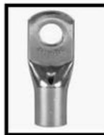
Figura 7: Terminal à compressão para cabos de 50/70 mm 2 .