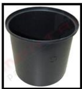
Figura 10: Caixa de Inspeção Tipo Solo em Polipropileno Preta.