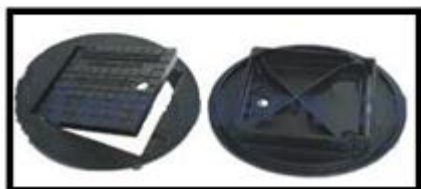
Figura 11: Tampa Reforçada com Escotilha em Ferro Fundido.