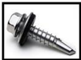
Figura 9: Parafuso Autoperfurante Sextavado.