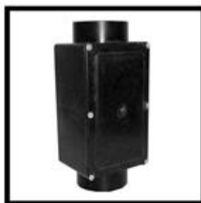
Figura 12: Caixa de Inspeção Polipropileno Suspensa 1. 1/2" .