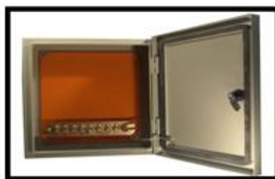
Figura 14: Caixa de Equipotencialização com 9 Terminais.