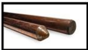
Figura 3: Hastes de cobre de 5/8" x 2,4m, (alta camada).