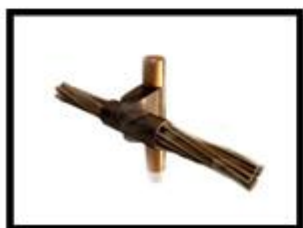
Figura 4: Solda Exotérmica Haste x Cabo.