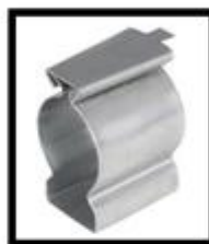
Figura 6: Abraçadeira Aço Galv. Tipo "D".