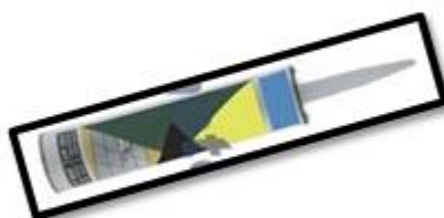
Figura 13: Selante em Poliuretano Flexível.