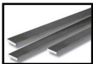
Figura 1: Barra chata em alumínio 7/8" x 1/8" – 70mm 2 .

Qualquer alteração no projeto só poderá ser feita com a autorização por escrito do autor do projeto em questão