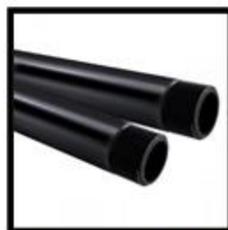
Figura 8: Eletroduto PVC Ø 01" Barra 3m