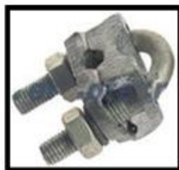
Figura 5: Conector cabo-haste em bronze estanhado.